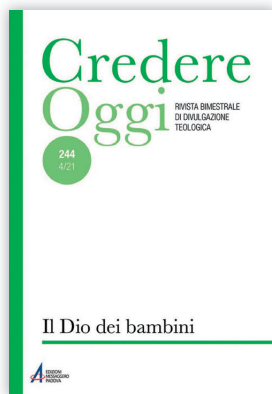
AA.VV. Il Dio dei bambini Messaggero 2021 - pp. 177 - € 9,50

Entrato subito in classifica tra i titoli più venduti, il libro è scritto da un prete domenicano francese e da un economista che si misurano sul tema del Sinodo che stiamo vivendo, alla luce di Fratelli tutti . Trovano spazio tutti i temi che la Chiesa in questo nostro tempo è chiamata ad affrontare, tra i quali l'autorità, il servizio sacerdotale, la parità tra uomini e donne, il coinvolgimento di tutti. Lo fanno con grande apertura, in sintonia con la nostra tradizione antica e recente.